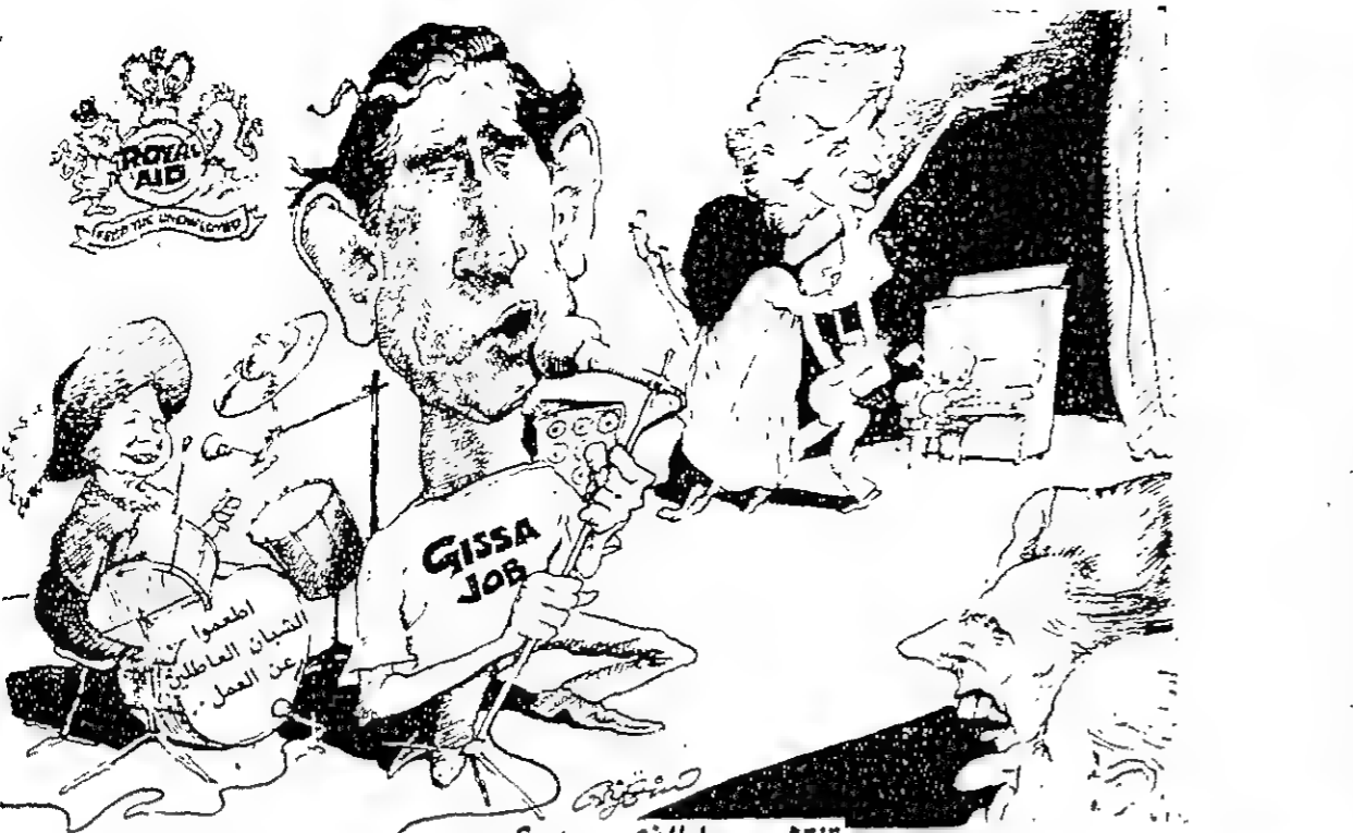
تاتشر: «ما الذي يريد؟»